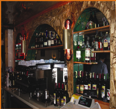
የተሟላ ምግብ ቤት