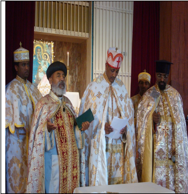
የቀሲስ ወንድምነህ የቅስና ሹመት