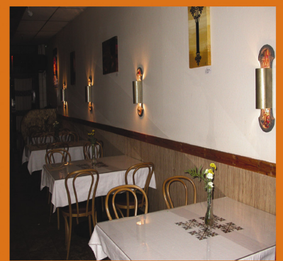
ጠቅላይ ምግብ ቤት