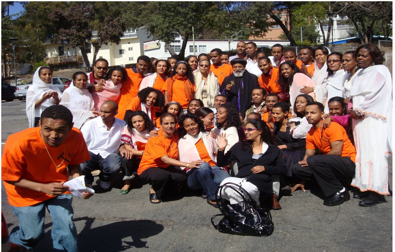
የመካነ ሰላም መድኃኔዓለም የሐመረ ፍህ የሰንበት ት/ቤት የመድኃኔዓለምን በዓል ሲያከብሩ